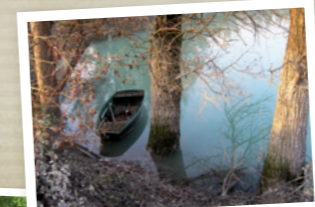
TAVO DI VIGODARZERE